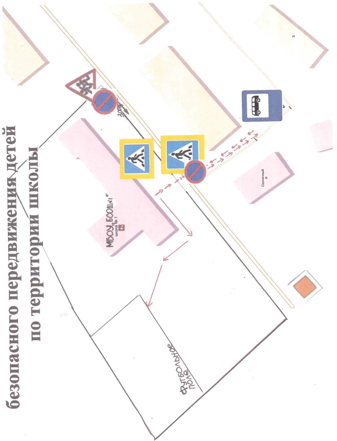
Схема безопасного передвижения детей по территории школы

Зиндэргэе Хүрэнгэр МБОУ, БСОШ №1 Орш Вн Салбаруул